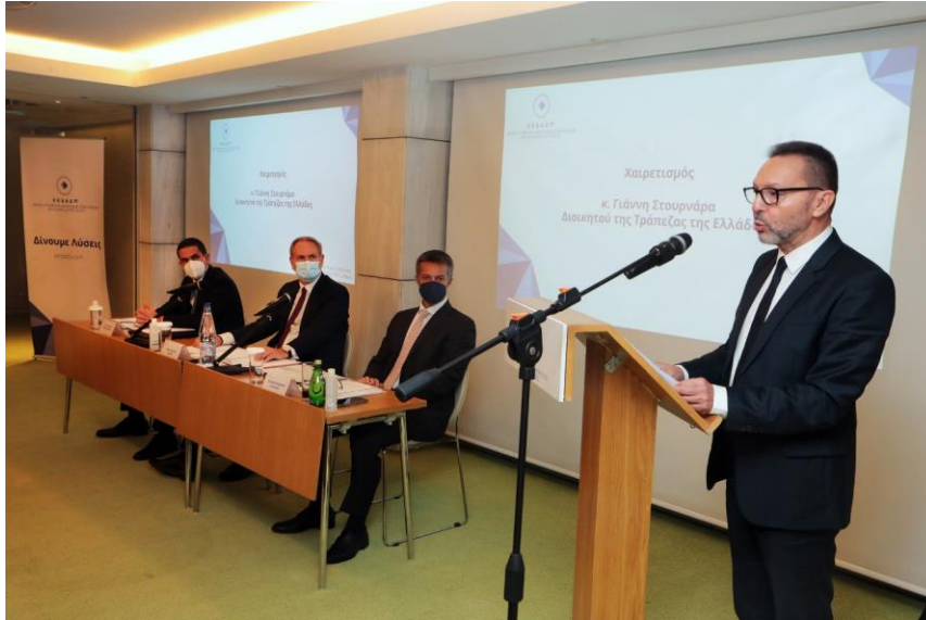
Ο διοικητής της ΤτΕ κ. Γιάννης Στουρνάρας στο βήμα. Στο πάνελ από δεξιά, ο Αντιπρόεδρος της ΕΕΔΑΔΠ Περικλής Κιτριλάκης και ο Πρόεδρος της Ένωσης, κ. Τάσος Πανούσης.